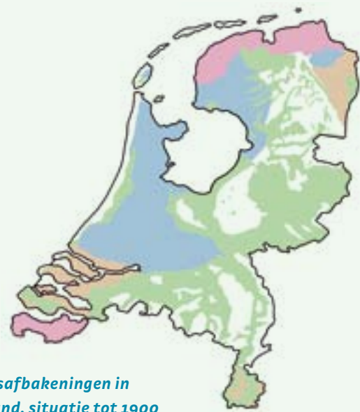
Perceelsafbakening in Nederland, situatie tot 1900

De agrarische geschiedenis van Nederland begon 7000 jaar geleden en ging door de millennia heen ten koste van veel ongerepte wilde natuur. Deze was rond 1900 vrijwel geheel verdwenen. Maar de topografische kaarten uit dezelfde tijd tonen een indrukwekkend labyrint van sloten, houtwallen, heggen, graften, bomenrijen, dijkes, lanen, akkerranden en elzenhagen met een geschatte lengte van in totaal 450.000 kilometer. Vrijwel heel Nederland was ermee bedekt. Daarbij kwam nog dat het landschap goed toegankelijk was door een fijnmazig netwerk van karrensporen, kerkenpaden, veldwegen, lanen en waterwegen.