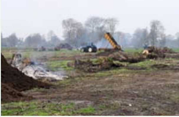
Honderdduizenden kilometers perceelsafbakening verdwenen in minder dan een eeuw ruilverkavelen.

ruilverkavelingen en de landbouwhervorming, had geen oog voor opa's eik of voor natte plekken met orchideeën. De mensen die een ruilverkaveling uitvoerden kwamen meestal niet uit de streek. Het 'ruilverkavelingscircus' kwam naar een streek, compleet met schaftketen, kantoor, drainagepijpen, bulldozers, stoomwalsen en landmeters. En ze bleven vijftien jaar of langer. Bijna iedere streek in ons land is bezocht, sommige zelfs meerdere keren. Tussen 1924 en 1985 werden 1700 ruilverkavelingen uitgevoerd in 70% van het landelijk gebied.