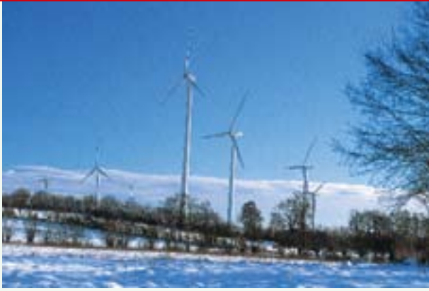
Twee vormen van groene stroom: windmolens en hout uit houtwallen.