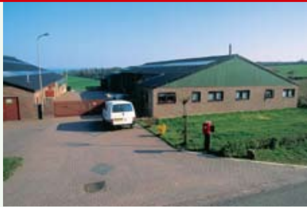
Type: Ruilverkavelingsboerderij. Streek: Overal.

De ruilverkavelingen hebben het overgrote deel van de landschapselementen weggevaagd. Op veel plaatsen heerst leegheid en verlatenheid.