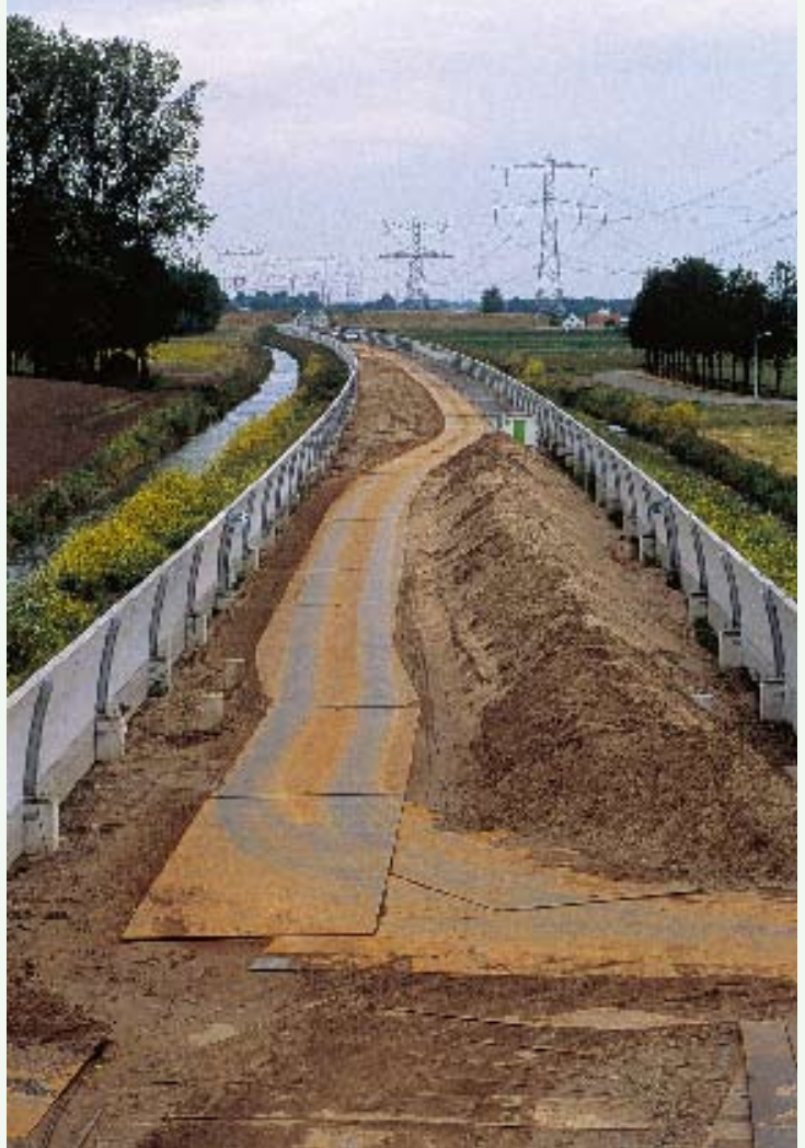
De Betuwelijn; een muur die ons land in tweeën splitst. Niet rendabel, geen draagvlak, toch in vijf jaar gebouwd.

Met een mooi landschap, goed ontsloten en buiten alle bebouwde kommen in heel Nederland, zal de spoeling iets dunner worden, maar die 8 miljard uit de recreatiesector kan gemakkelijk uitgroeien tot enkele tientallen miljarden euro's. Nu al gaat het dus om een geringe staatsinvestering in een zeer winstgevende branche. De staat investeert ook in andere economische motoren van ons land en deze investeringen zijn niet altijd onomstreden. Zo is de peperdure Betuwelijn een staatsinvestering ten gunste van met name de Rotterdamse haven, waar jaarlijks € 6 miljard wordt omgezet. Ook de aanleg