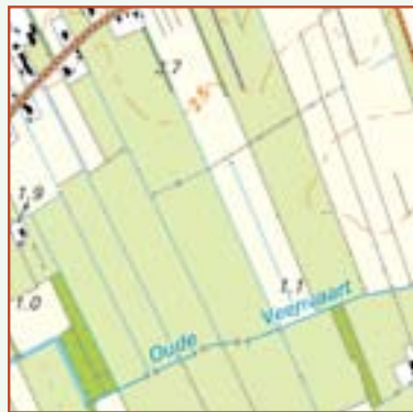
Alleen al op deze vierkante kilometer in het zuiden van Friesland is zes kilometer aan veldwegen en paden verdwenen.

De schaalvergroting vond ook plaats in landen als Engeland en Frankrijk, maar het karakter van het landschap bleef daar overeind.