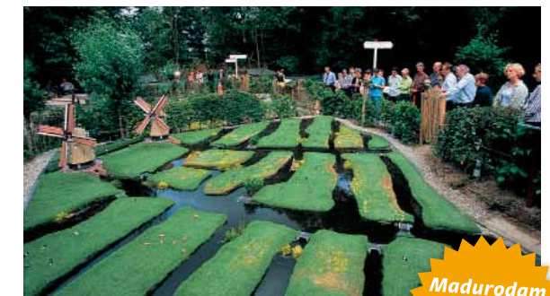
Madurodam van het landschap