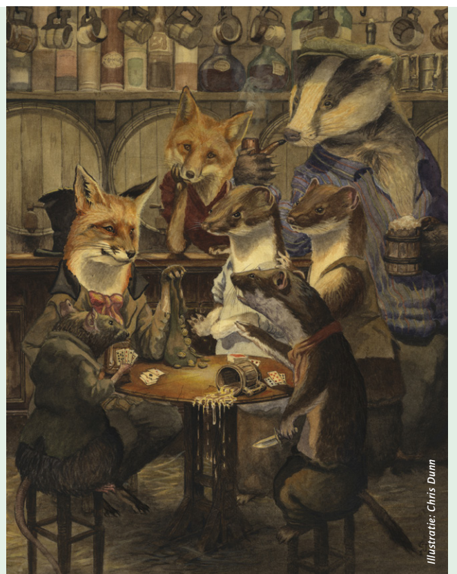
Illustratie: Chris Dunn