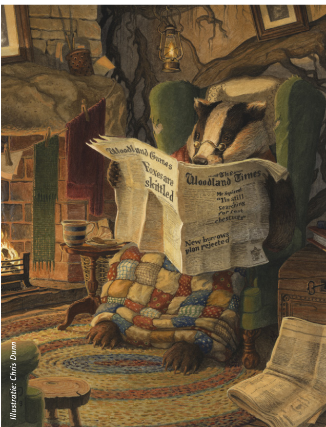
Illustratie: Chris Dunn

Toen zo'n ruim zesduizend jaar geleden de landbouw in Nederland de overhand kreeg over jagen en verzamelen, werd het wonen op vaste plekken de dominante manier van leven. Bij voortdurende werden planten- en dierenrassen uitgeselecteerd en werden wilde dieren en planten die oogst en productie konden schaden, van weides en akkers geweerd. En ook al had ieders god in die tijd alle leven op aarde geschapen en gezien dat het goed was, volgens de boeren was er ongedierte en onkruid. Ondieren en onkruiden waren schadelijk en moesten uitgeroeid en verdelgd worden, god of geen god.