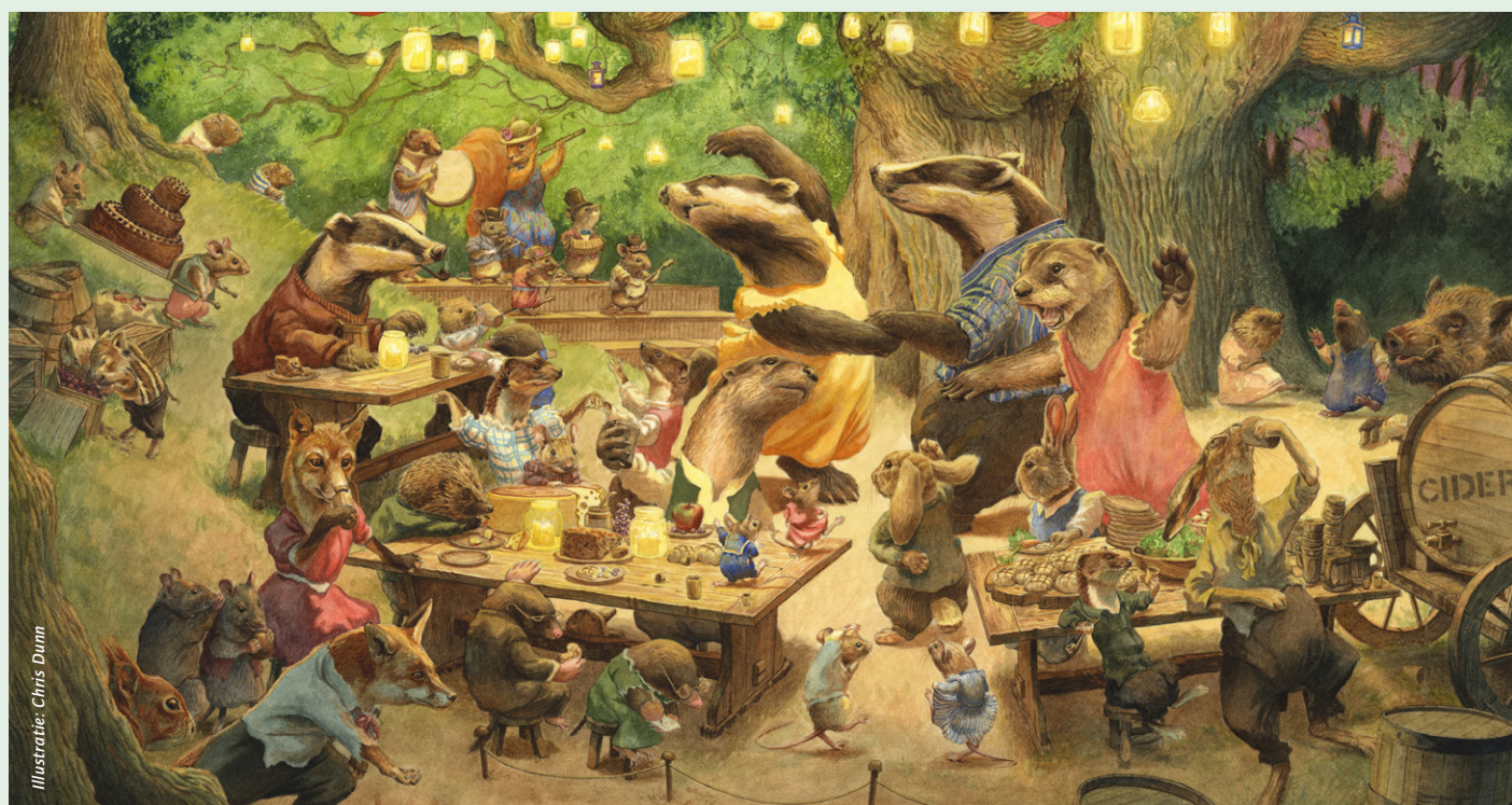
Illustratie: Chris Dunn

De das wordt veelal afgebeeld als gezellig, lieflijk, nukkig, wijs, belezen en hardwerkend.