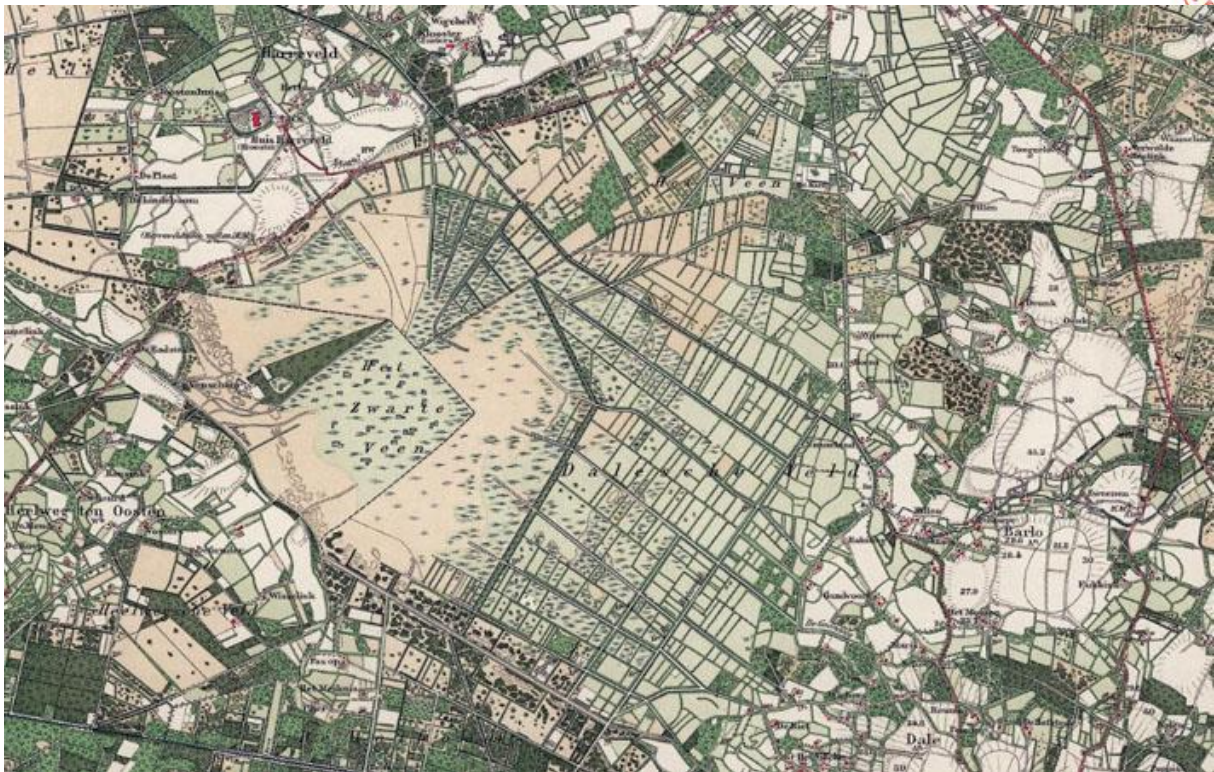
Aaltense Goor anno 1925